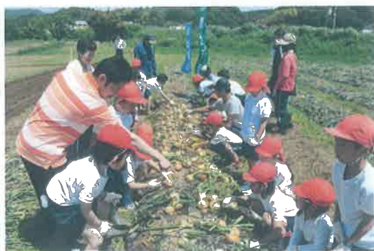
子どもへの食農教育