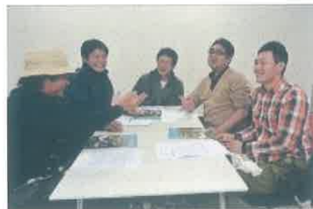
JA広報誌へ協力しPR（座談会）