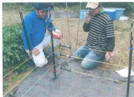
支部での電気柵設置