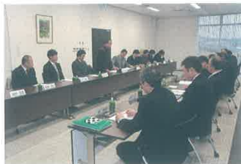
J A 役員との意見交換会