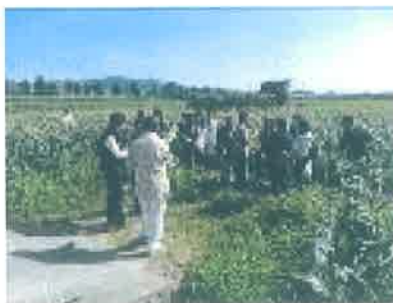
農業体験 de 婚活