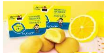
「湘南潮彩レモン」を使った商品の開発にも取り組みました。

有害鳥獣被害に強く、長期間にわたり販売が可能であるレモンに着目し、生産者部会の立ち上げについて検討を重ねています。また、「湘南潮彩 しおさい レモン」の登録商標を取得したことによりブランド化をはかります。