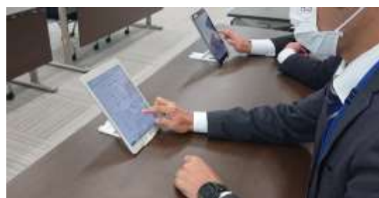
▶ タブレット端末機を使ったペーパーレス会議

情報システムの活用による業務の効率化をはかるため、Web研修システムの利用拡大や、ペーパーレス会議システムの導入を進め、事務効率の改善を目指しています。