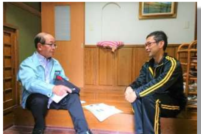
▲認定農業者等へ戸別訪問を実施し貴重な意見をいただきました。

JAが取り組む「不断の自己改革」を周知するとともに、認定農業者等への戸別訪問や組合員座談会を実施し、正・准組合員との対話運動による組合員の生の声をJA事業に反映するよう取り組んでいます。