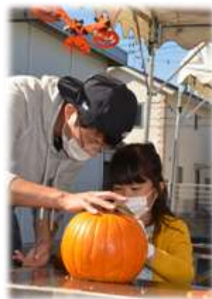
▲「秋のめぐりスクール」 でかぼちゃのランタン作り

教育の一端を担い、管内の小学生から高校生まで、それぞれの分野に対する研究心を深めてもらうため、神奈川県農業協同組合中央会や全国共済農業協同組合連合会が主催する作文・図画・書道コンクールに参加しています。