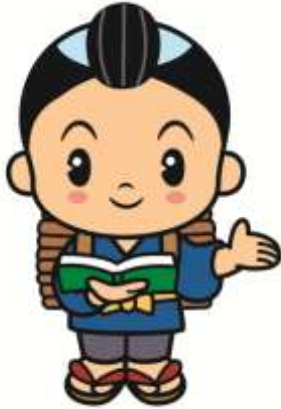
JAかながわ西湘マスコットキャラクター 西湘きんじろう