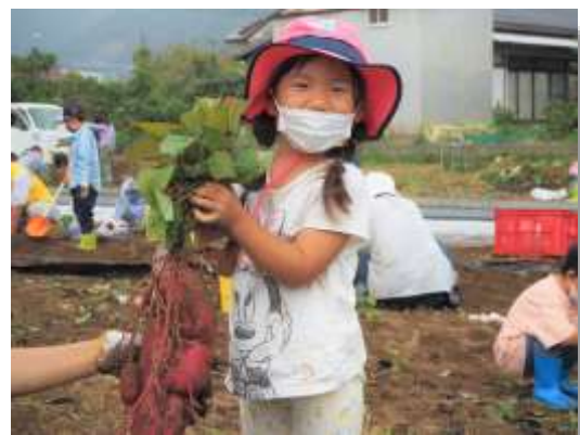
▲「サツマイモの収穫体験と秋の味覚」をテーマに准組知っトク講座を開催