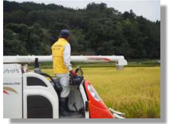
▲農作業受託事業の様子

4月に発足した農業支援隊の協力のもと、従来からの水稻春・秋作業に加え、柑橘の防除、茶の台刈りについて試験的に実施しました。今後は、本格的に受託を開始するとともに、段階的に作業項目の拡大を図り、組合員の負託に応えるよう進めます。