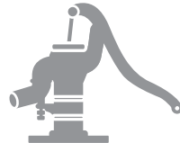
農業用の井戸・水道