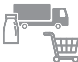
加工・流通・販売