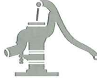
農業用の井戸・水道