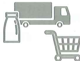
加工・流通・販売