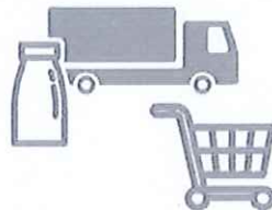
加工・流通・販売