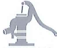
農業用の井戸・水道