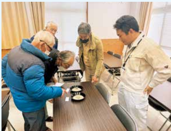
『にじのきらめき』と『コシヒカリ』の違いを学ぶ農業機械銀行成田推進班

今、注目の水稻品種『にじのきらめき』について学ぼうと、農業機械銀行成田推進班は、11月9日・10日に千葉県の印旛沼地域にある『スーパースーパー水田』と茨城県農業研究所水田利用研究室を視察しました。『にじのきらめき』は高温耐性に優れ、大粒で食味も良好。当日、コシヒカリと比較し違いなどを学ぶとともに、高品質安定多収栽培方法についての知識を深めました。参加者は「年々、気温が上昇し、これからの稲作に欠かせない品種だと思った。『はるみ』とともに栽培にチャレンジしてみたい」と意気込みを語りました。