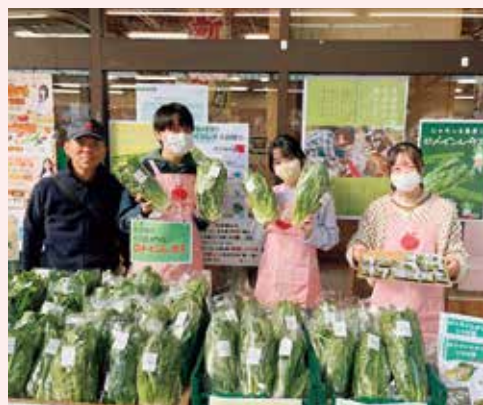
学生と生産農家が魅力をPRしました

日本大学生物資源科学部の学生は、全農ががわや生産農家と協力し、ロメインレタスの魅力発信に取り組んでいます。11月15日には、生産農家と一緒に『朝ドレファーム』成田店でPR販売会を行いました。ロメインレタスは、加熱してもシャキッとした食感が残ります。その魅力を生かしたレシピを開発し、当日はレシピ集を配布。また、おいしさを味わってもらおうと、バターで炒めて地元産のレモンをかけた試食品を配りました。「爽やかでシャキシャキしておいしい」と好評で、161袋用意したロメインレタスは完売しました。