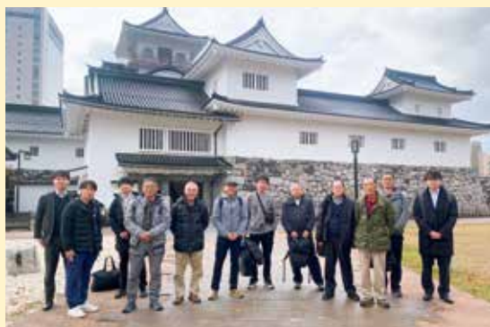
富山城の前で記念撮影

水稻の種もみを生産している足柄採種組合は、11月25・26日に県内の種もみ生産者とともに富山県に視察に訪れました。同県は『種もみ王国』とも呼ばれる日本有数の種もみの産地。全国の種もみ受託生産量は約6割を占め、さまざまな品種を43都府県へ出荷しています。視察では富山県農林水産総合技術センターや富山県主要農作物種子組合を訪れ、最新の栽培技術から、高品質な種もみを作るための技術や品質管理方法等を学びました。参加者は「とても有意義な視察だった」と話しています。