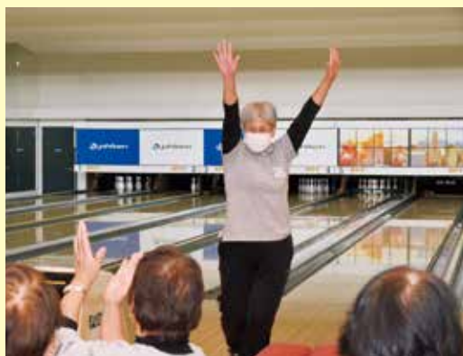
ストライクに喜ぶ部員

ゲームではピンが倒れるたびに大きな歓声と笑い声が聞こえ、参加者は「ボウリングは20年ぶりだったけど楽しくプレーでき、おしゃべりしながらリフレッシュもできた」と笑顔を見せていました。